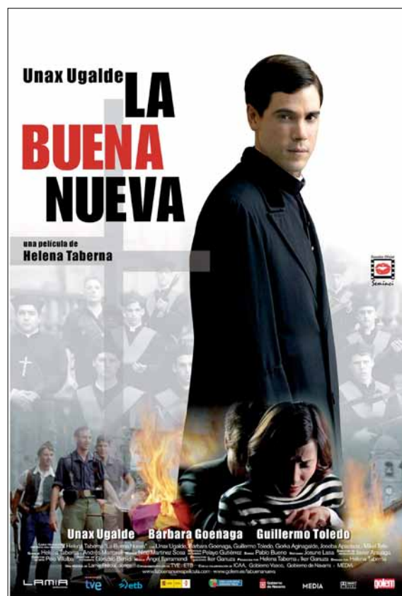
Cartel de La Buena Nueva

Por otra parte Lamia Producciones creó en 2003 una línea editorial para la elaboración de materiales didácticos y continúa con la línea de difusión del cine para la distribución en DVD entre las Administraciones Públicas. Para ello -como ya se hizo en su día con la película documental Extranjeras - Lamia ha elaborado un libro-guía para la utilización de La Buena Nueva en Universidades e Institutos. Han colaborado en la elaboración de la Guía prestigiosos historiadores como Ian Gibson, Roldán Jimeno y Julián Casanova.